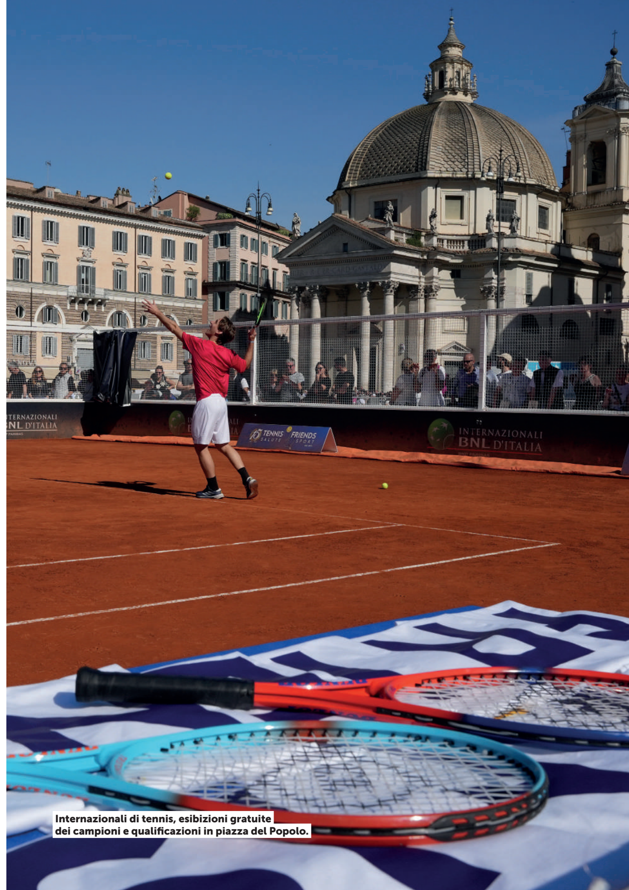
Internazionali di tennis, esibizioni gratuite dei campioni e qualificazioni in piazza del Popolo.

Inoltre, per il Sei Nazioni di Rugby , Roma Servizi per la Mobilità anche quest'anno ha realizzato la guida Roma Gioca Sostenibile , per raggiungere la partita integrando trasporto pubblico e spostamenti a piedi, in bicicletta, con i mezzi in sharing e con quelli della micromobilità elettrica. A disposizione anche una navetta della Federugby, in partenza da Termini. Una sperimentazione positiva per ridurre l'impatto ambientale della mobilità verso il grande evento sportivo.