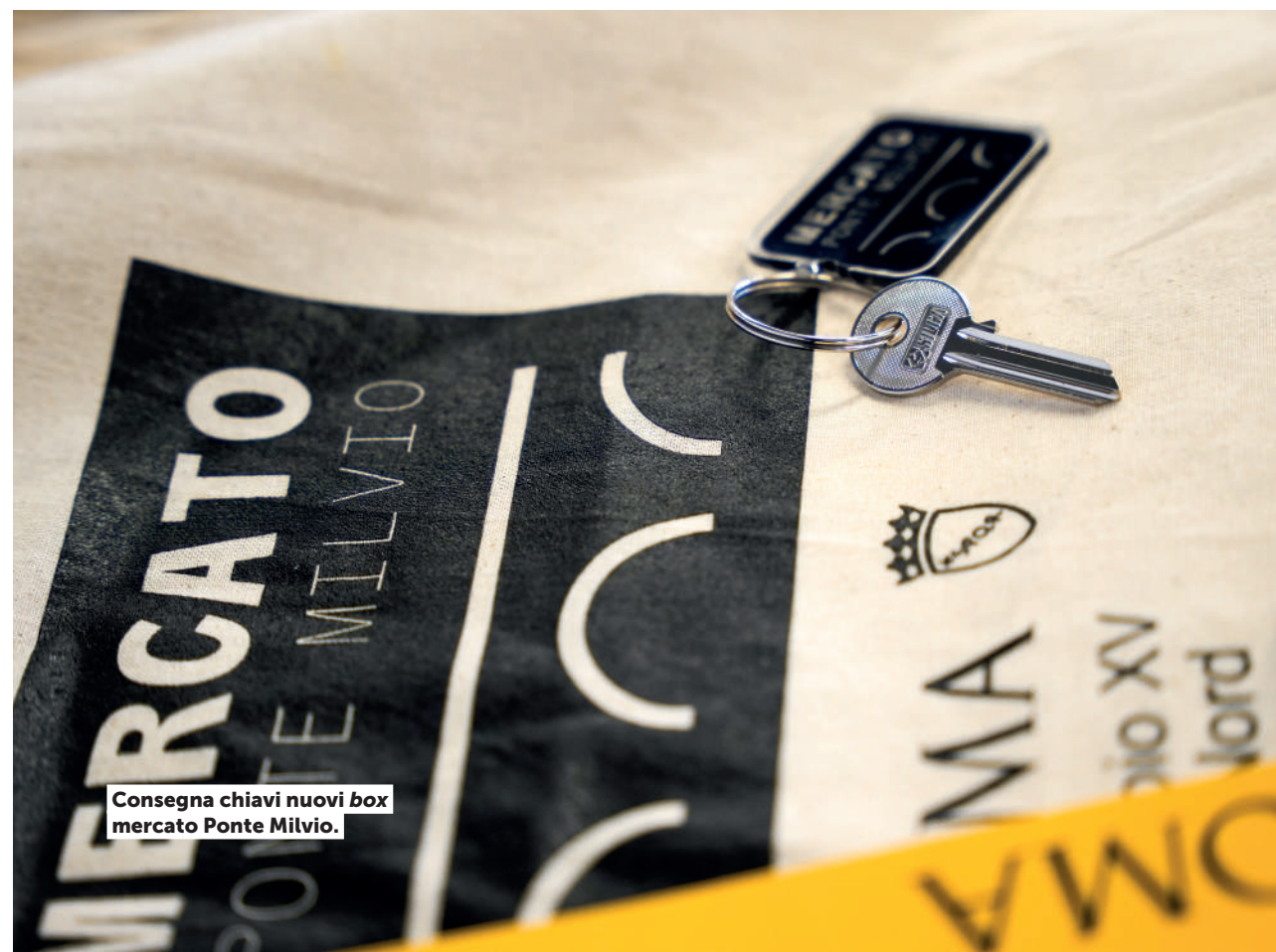
Consegna chiavi nuovi box mercato Ponte Milvio.

Sarà anche potenziato lo Sportello SUAP e sarà favorito l'impiego di impianti a LED e vietando ogni forma di distribuzione di volantini e manifestini , per ridurre l'inquinamento e lo smaltimento dei rifiuti.