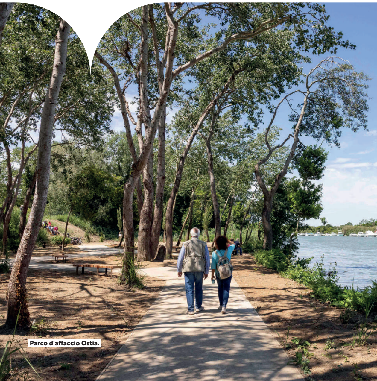
Parco d'affaccio Ostia.