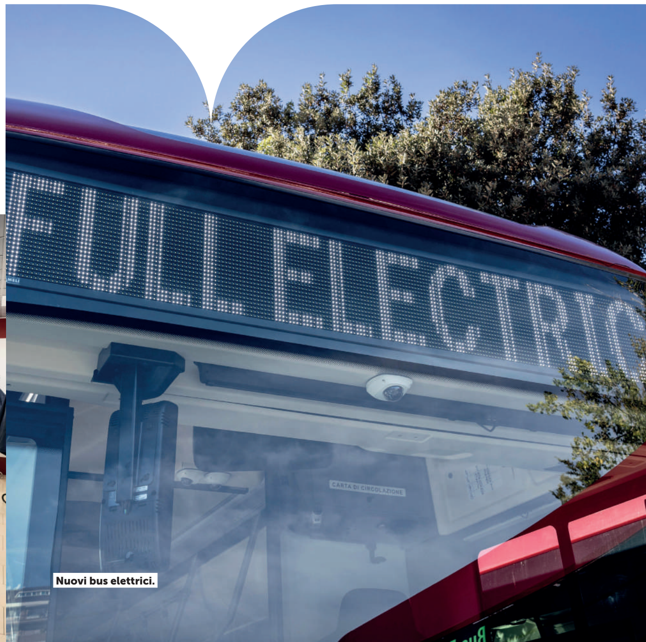
Nuovi bus elettrici.