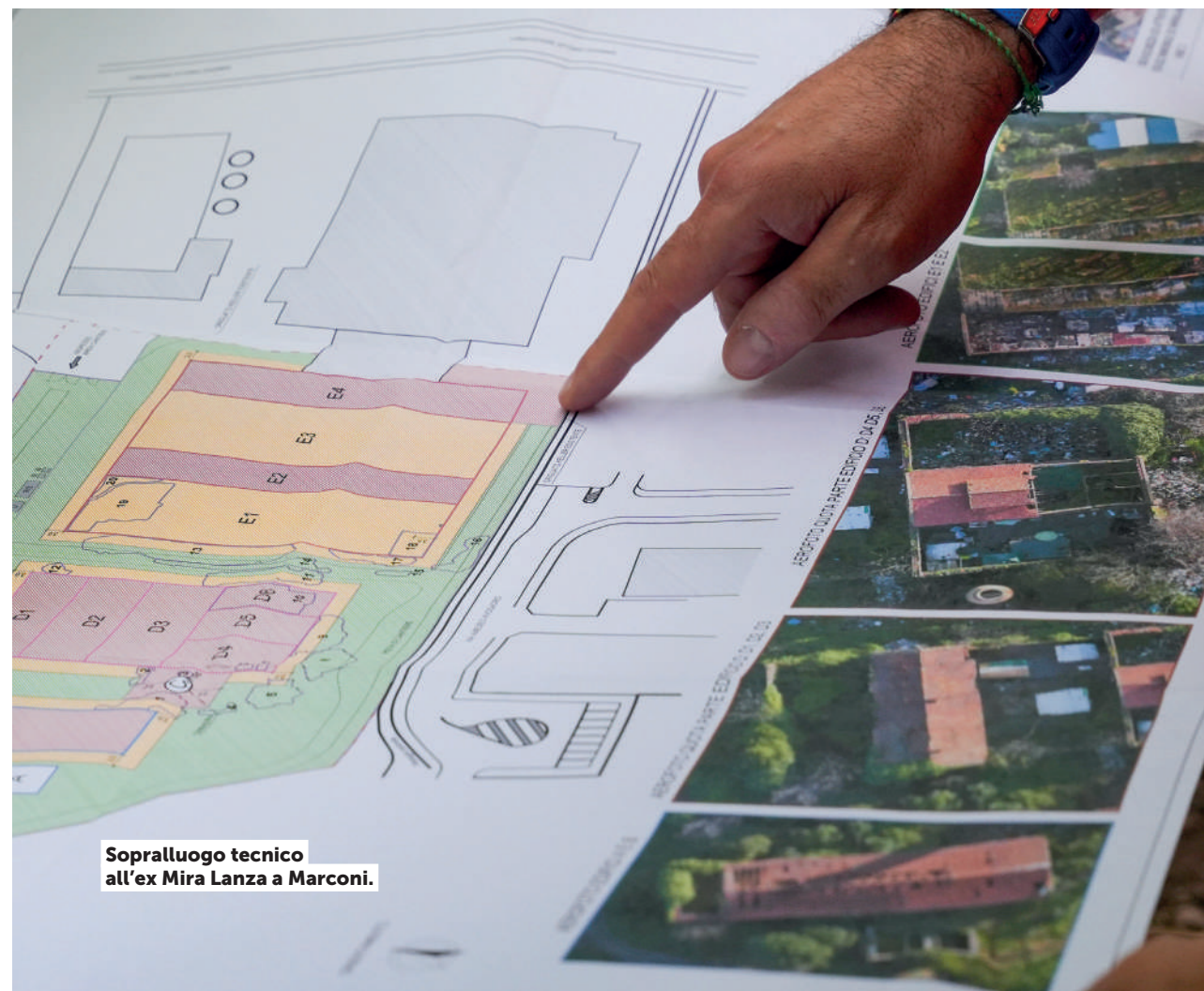
Sopralluogo tecnico all'ex Mira Lanza a Marconi.

Operativo anche Re-Greenation , il progetto Horizon finalizzato a verificare l'impatto delle iniziative di rigenerazione urbana a base green, anche tramite l'uso dell'intelligenza artificiale e del digital twin , al fine di contribuire alla mitigazione del cambiamento climatico urbano e ad aumentare la coesione sociale.