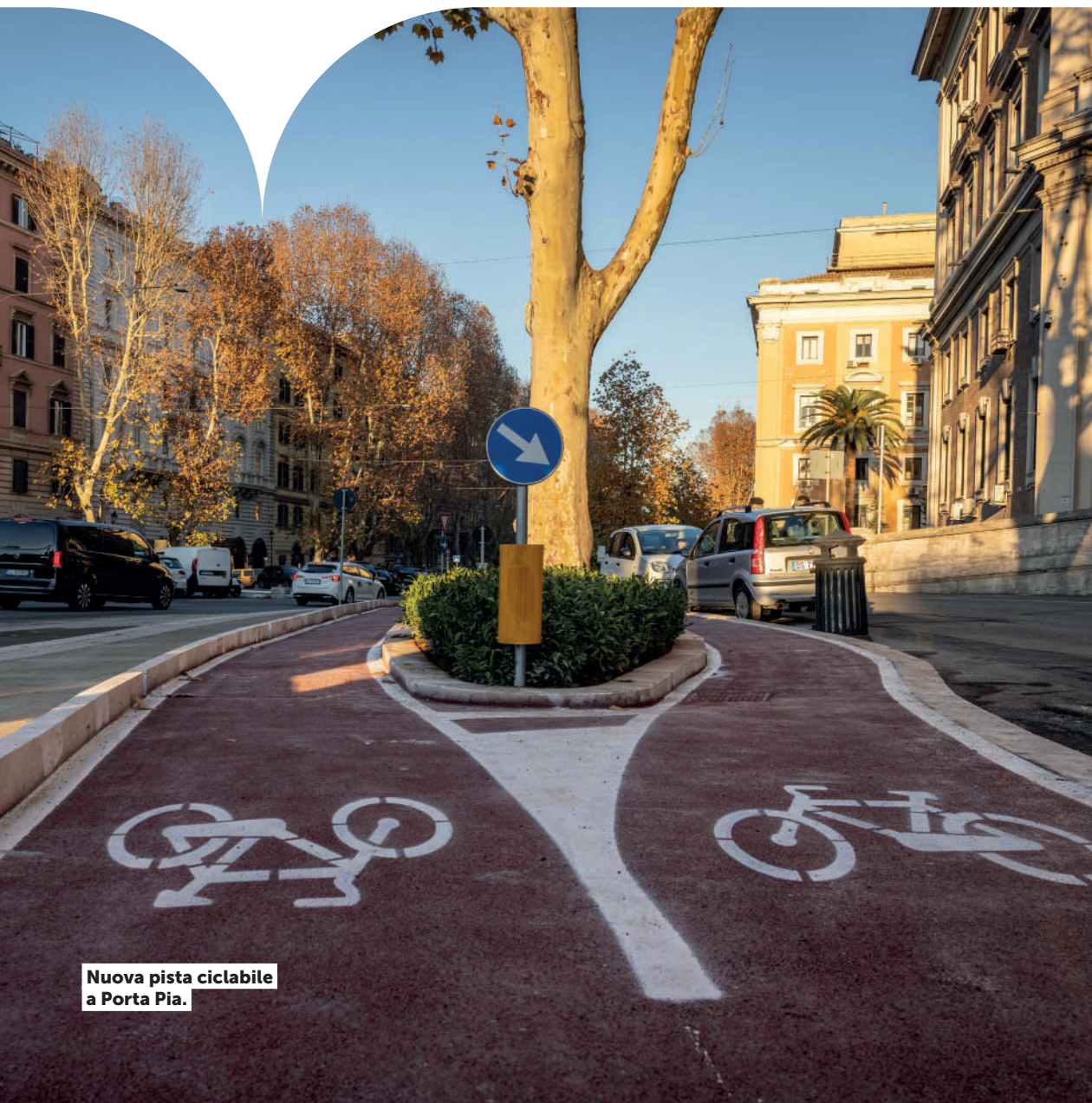
Nuova pista ciclabile a Porta Pia.