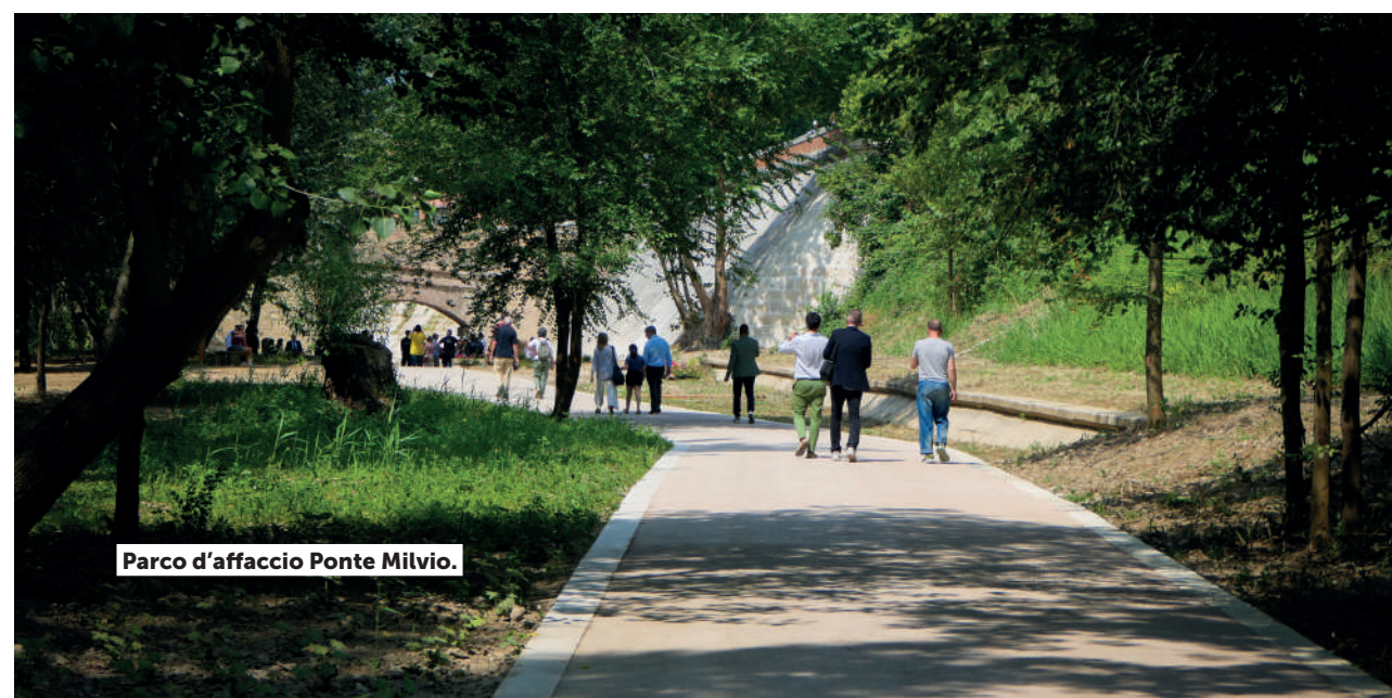
Parco d'affaccio Ponte Milvio.

Inoltre, ad ottobre 2025 si è svolta la terza edizione del Sabato Blu , evento promosso da Roma Capitale, che aderisce alla XIV Giornata nazionale del Camminare organizzata da FederTrek .