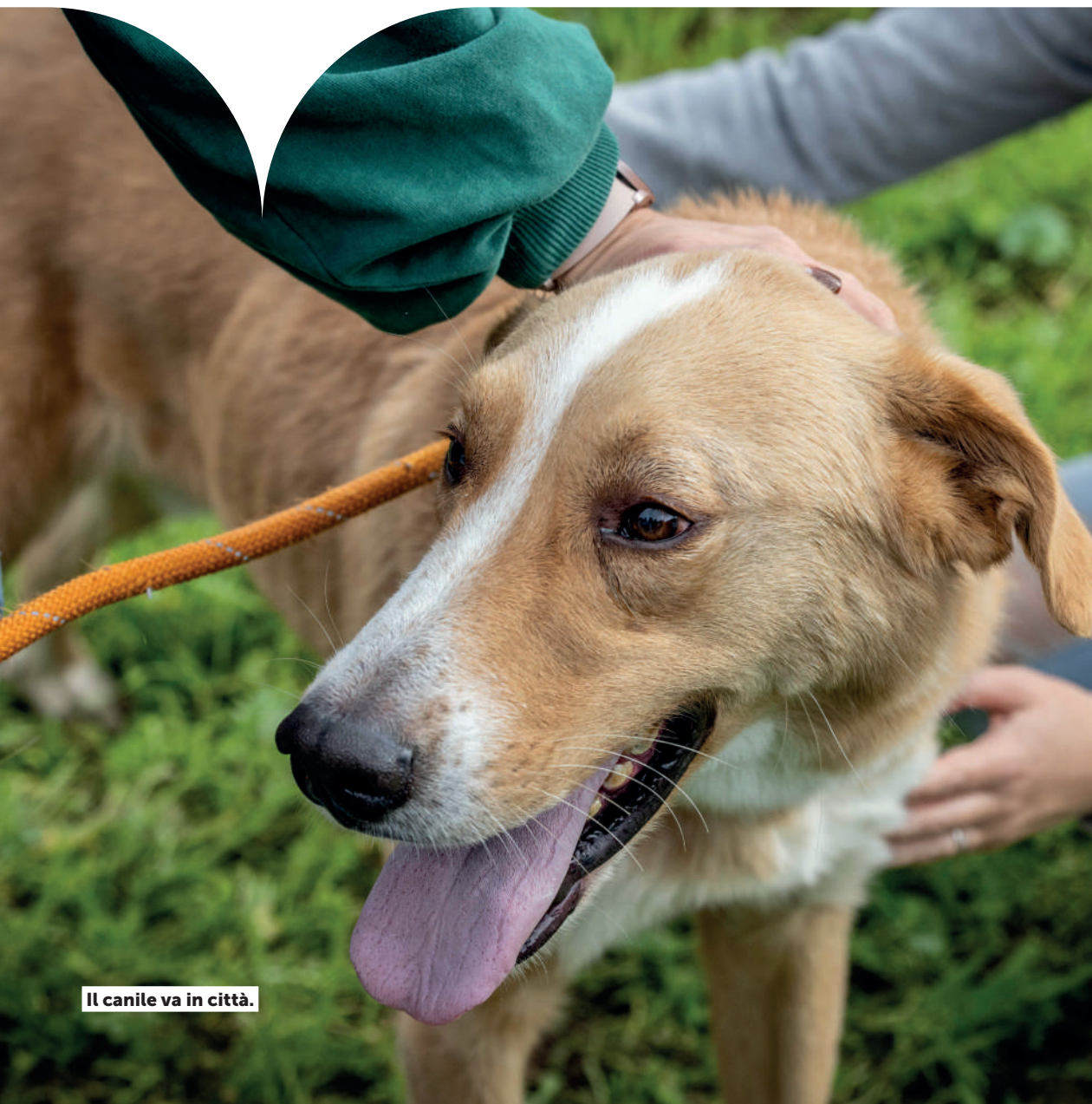
Il canile va in città.

Partiti a febbraio 2025 i lavori per la ristrutturazione e l'ampliamento (30/60 nuove cucce) del Canile della Muratella, e per la realizzazione del primo ospedale veterinario pubblico (all'interno delle strutture esistenti anche recuperando spazi non utilizzati, con una superficie di oltre 900 mq con sale operatorie, nuovi ambulatori e pronto soccorso), per un importo stimato di circa 6,5 milioni di euro. Fine lavori nel 2026.