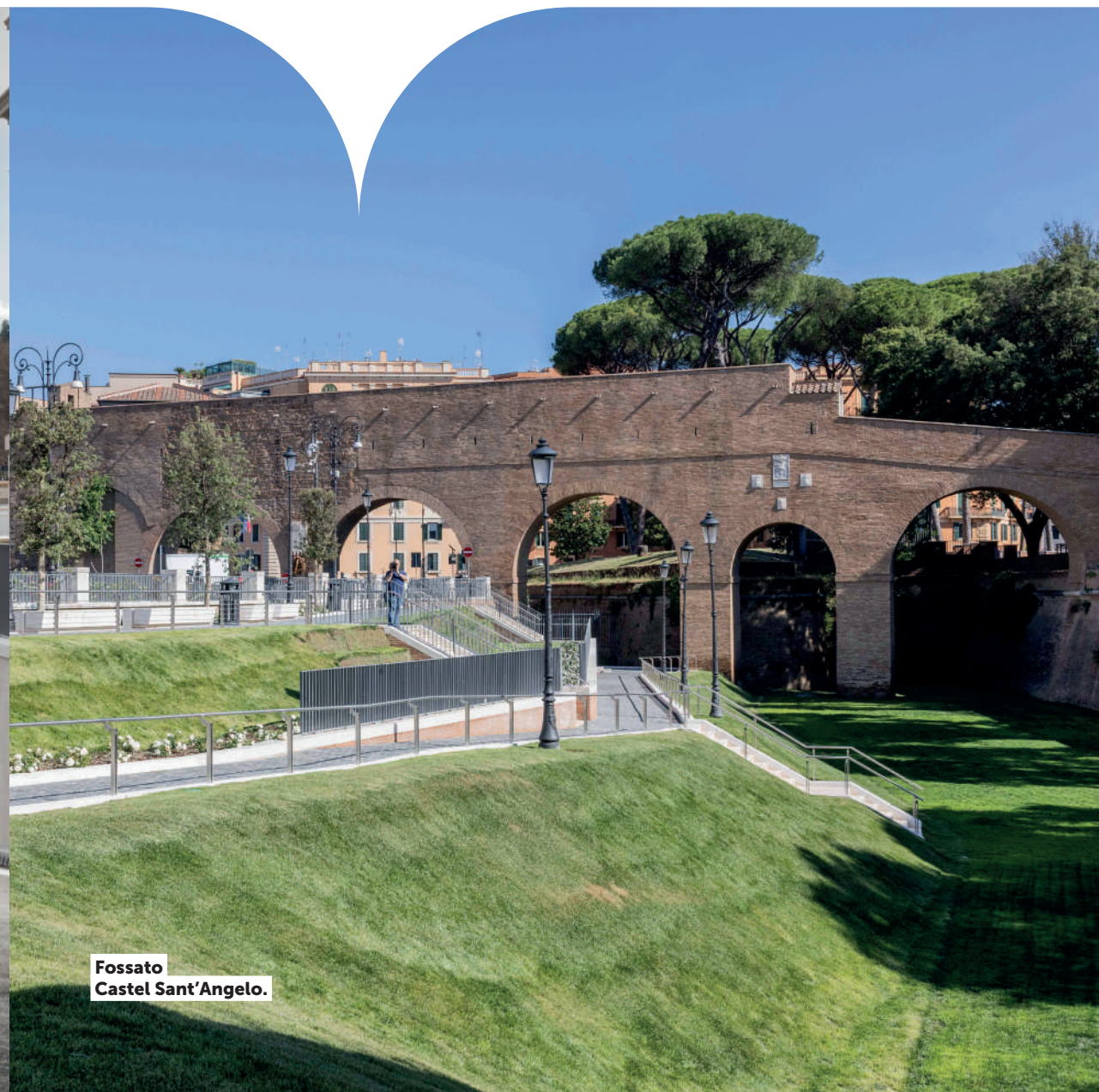
Fossato Castel Sant'Angelo.