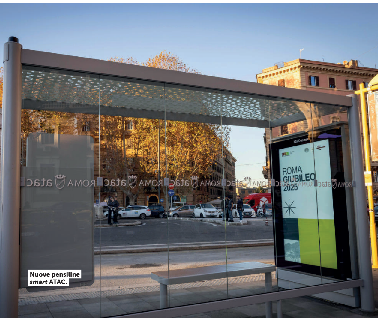
Nuove pensiline smart ATAC.