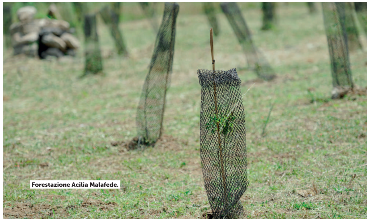
Forestazione Acilia Malafede.

A ottobre 2025 Roma è stata premiata nella categoria Best City agli Awards promossi nell'ambito dell'Assemblea della World Farmers Markets Coalition , come migliore città a sostegno del cibo locale.