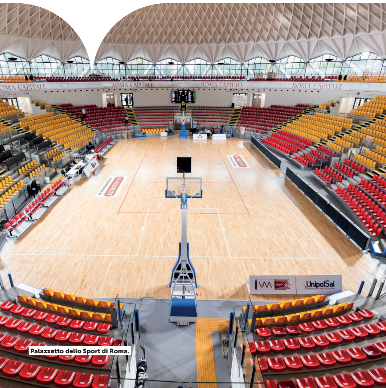
Palazzetto dello Sport di Roma.

Dopo aver approvato nel 2023 il nuovo Regolamento per la gestione dei 131 impianti sportivi di Roma Capitale accorpando, semplificando, aggiornando e rendendo omogenee in un unico documento le normative fino ad allora divise, l'Amministrazione capitolina ha proseguito l'azione di ripristino della legalità , a partire dal recupero degli impianti da gestori morosi per milioni di euro di canoni e mutui non pagati.