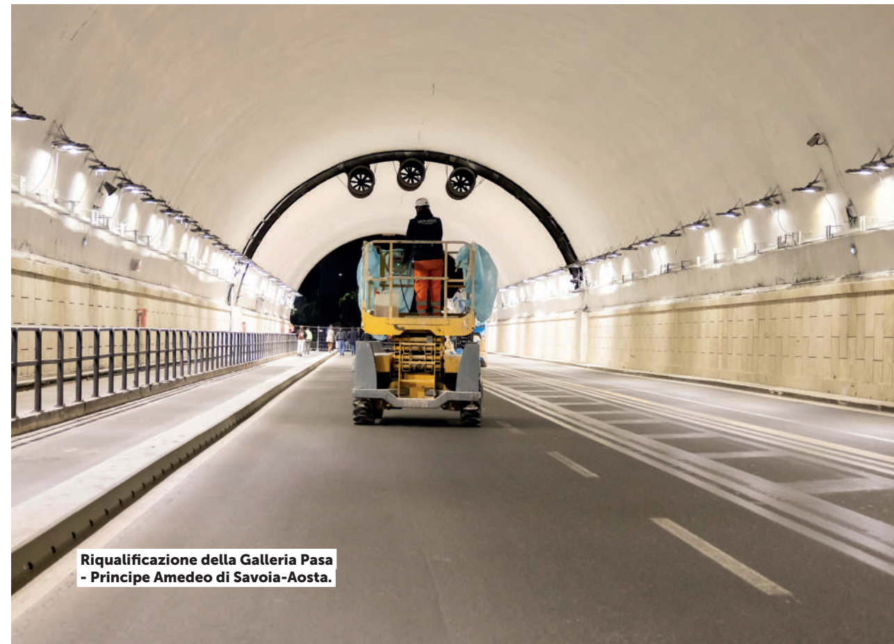
Riqualificazione della Galleria Pasa - Principe Amedeo di Savoia-Aosta.

Riportare Roma al ruolo di leader nel gruppo delle Capitali Europee è l'obiettivo dell'Amministrazione.