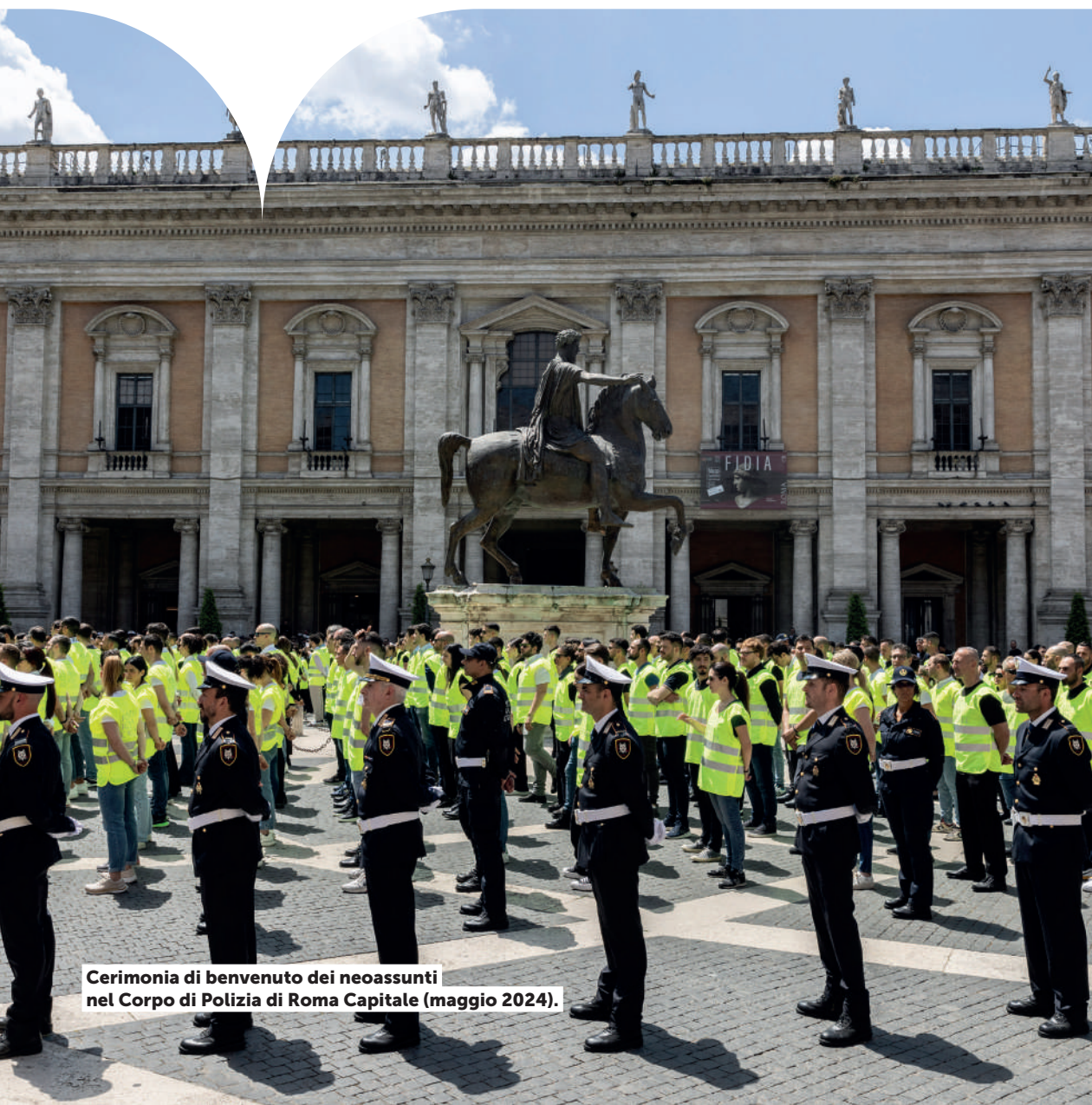
Cerimonia di benvenuto dei neoassunti nel Corpo di Polizia di Roma Capitale (maggio 2024).