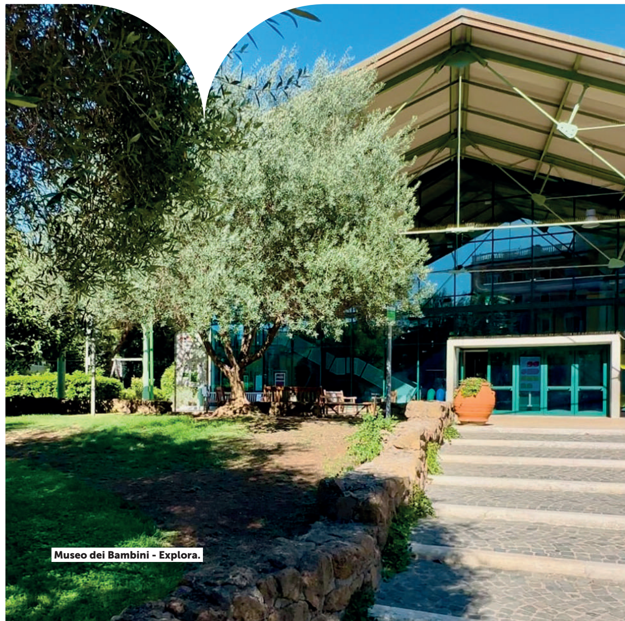
Museo dei Bambini - Explora.