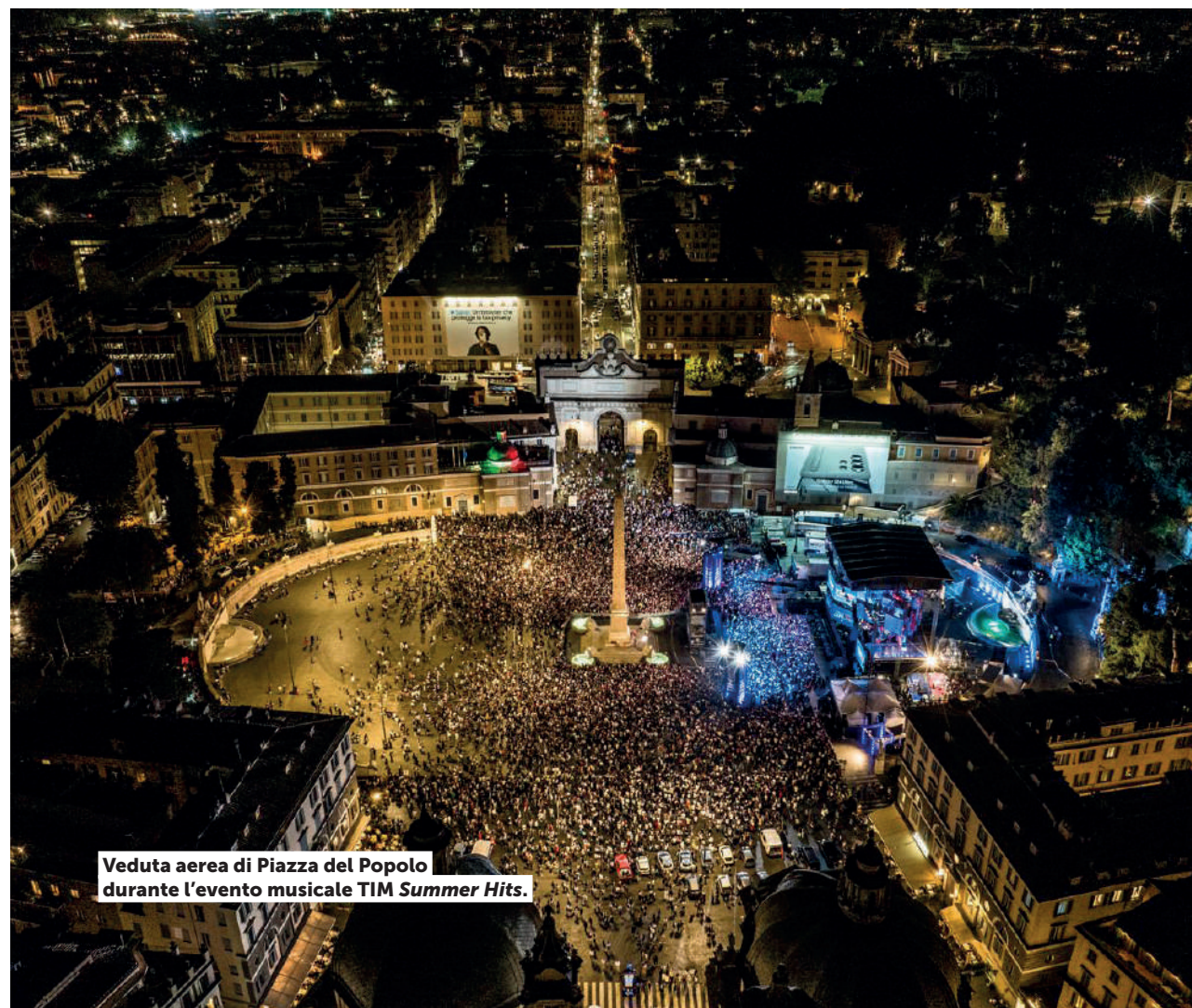
Veduta aerea di Piazza del Popolo durante l'evento musicale TIM Summer Hits.

Con la sfilata delle accademie di moda dal titolo " Ensemble 2024 – Talk, Academy and Designer " presso Villa Borghese, per il terzo anno consecutivo Regione Lazio e Roma Capitale hanno sostenuto e valorizzato le sfilate degli studenti degli istituti romani di alta formazione.