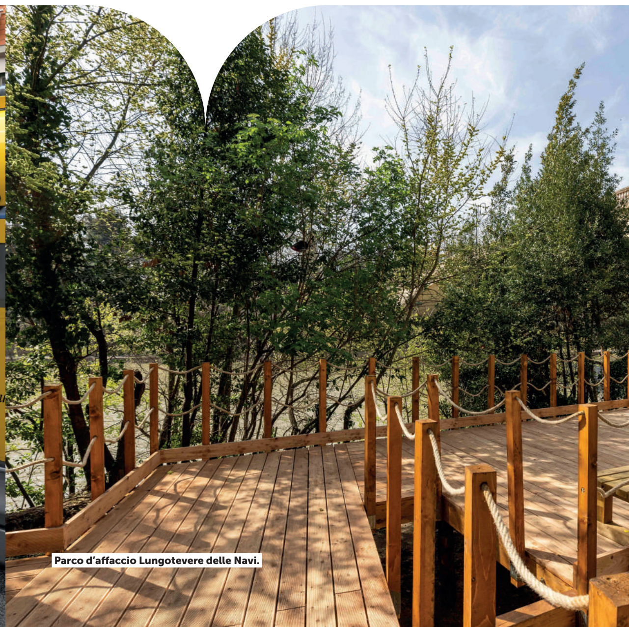
Parco d'affaccio Lungotevere delle Navi.