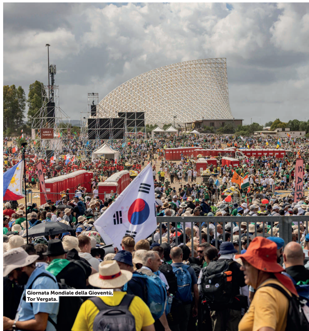
Giornata Mondiale della Gioventù, Tor Vergata.

Caput Mundi rappresenta il filone giubilare del PNRR. In questo caso, dai 333 interventi previsti (a Roma e fuori Roma), 81 sono conclusi, in corso 225 di cui 21 in chiusura entro fine settembre, 16 in partenza e, a seguire, altri 11. Sono finite o quasi finite il 35% delle opere programmate. La scadenza del 31 dicembre 2024 è stata rispettata, nei tempi anche per quella del 2026.