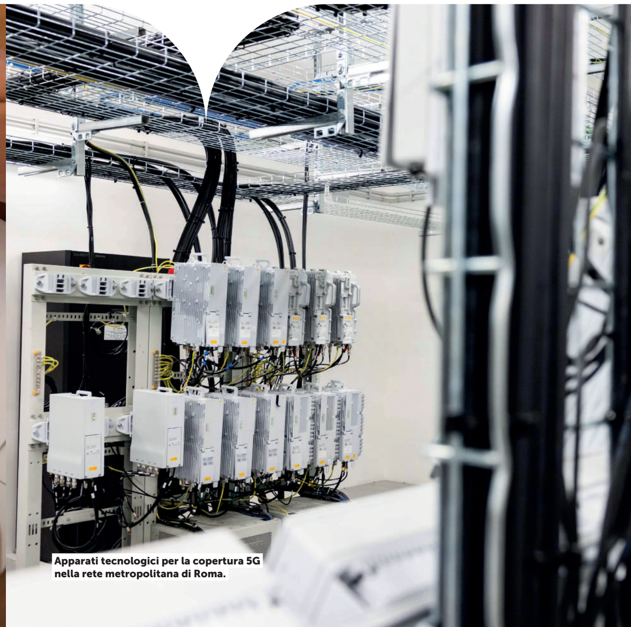
Apparati tecnologici per la copertura 5G nella rete metropolitana di Roma.