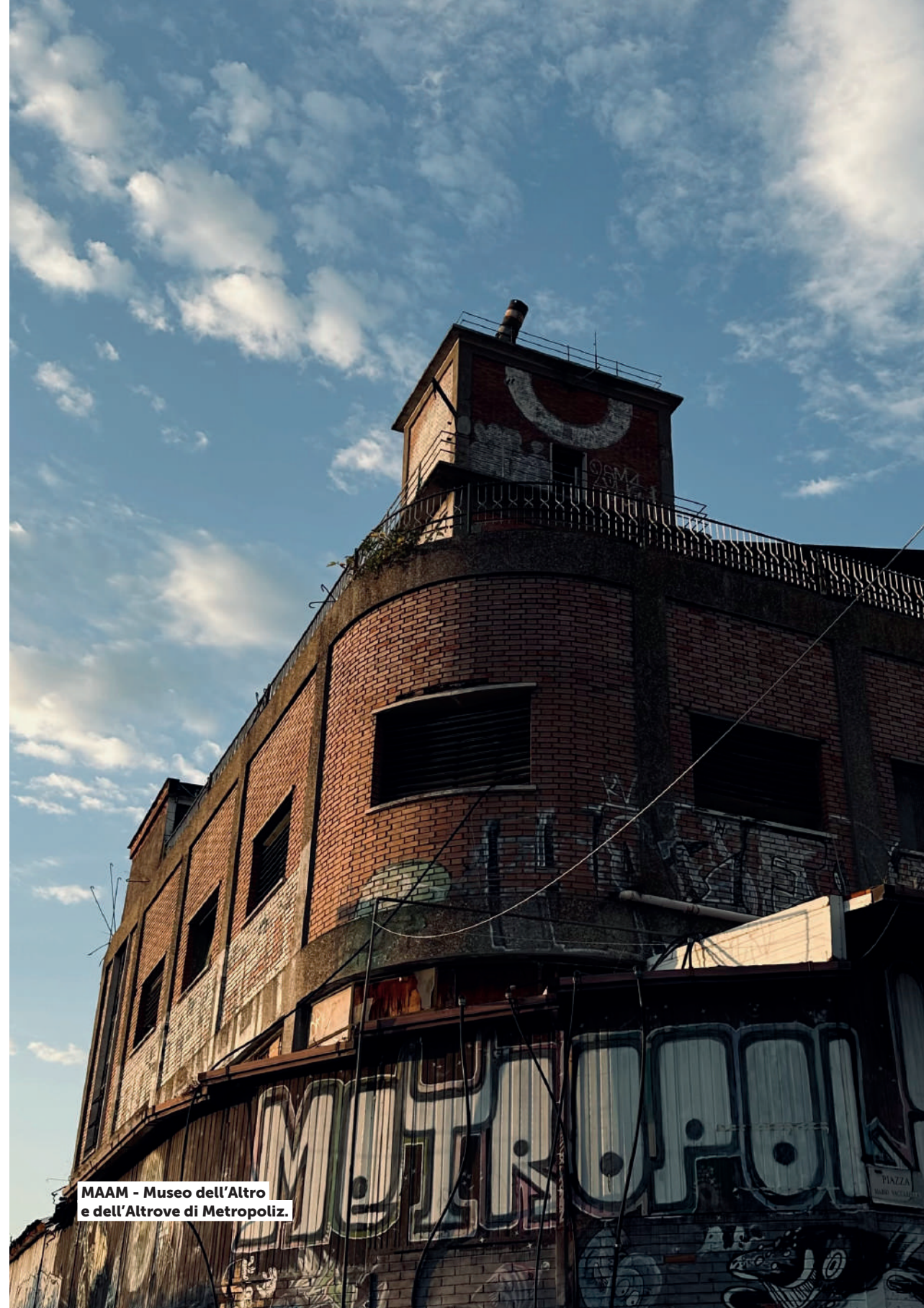
MAAM - Museo dell'Altro e dell'Altrove di Metropoliz.

Infine, per quanto riguarda il lavoro di riorganizzazione, efficientamento e riduzione dei fitti per gli immobili ad uso ufficio di Roma Capitale, prosegue la riattualizzazione del programma di completamento urbanistico-edilizio, in prossimità della stazione Ostiense, di Campidoglio 2 .