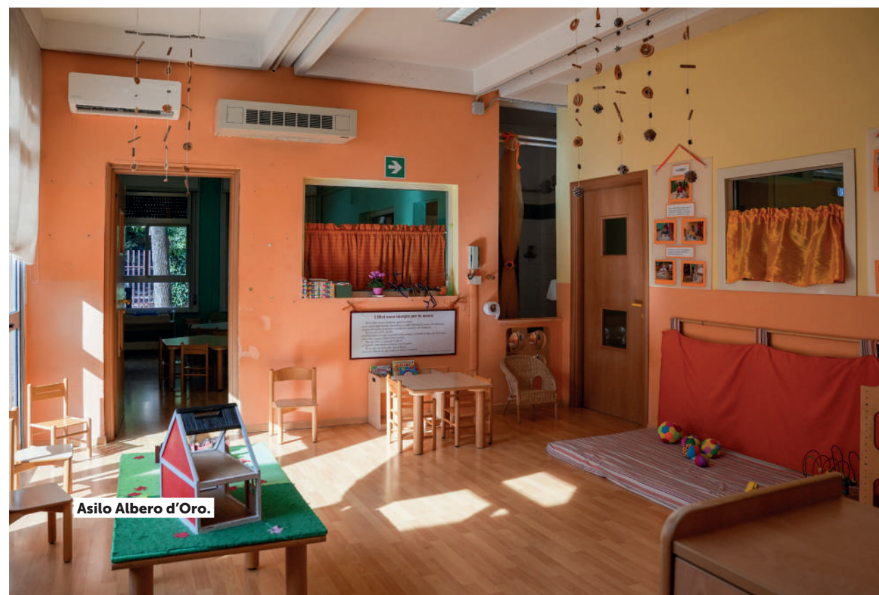
Asilo Albergo d'Oro.

Per il quarto anno di fila il primo giorno di scuola è stato garantito a tutti i bambini e le bambine con disabilità, trovando in classe l'operatore OEPAC loro assegnato.