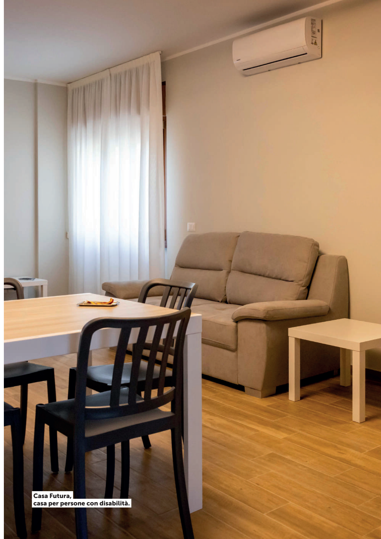
Casa Futura, casa per persone con disabilità.

Il 18 giugno 2025, in occasione della Giornata Mondiale del Rifugiato, ha aperto un nuovo appartamento destinato a minorenni stranieri non accompagnati tra i 16 e i 18 anni, all'interno dell'Opera Nazionale per la Città dei Ragazzi, a Roma. Il progetto è stato realizzato con il contributo della Fondazione Banca Nazionale del Lavoro. Con questa nuova apertura, salgono a 5 i gruppi di appartamenti attivi nella struttura di largo Città dei Ragazzi, portando la capacità complessiva di accoglienza a 42 posti .