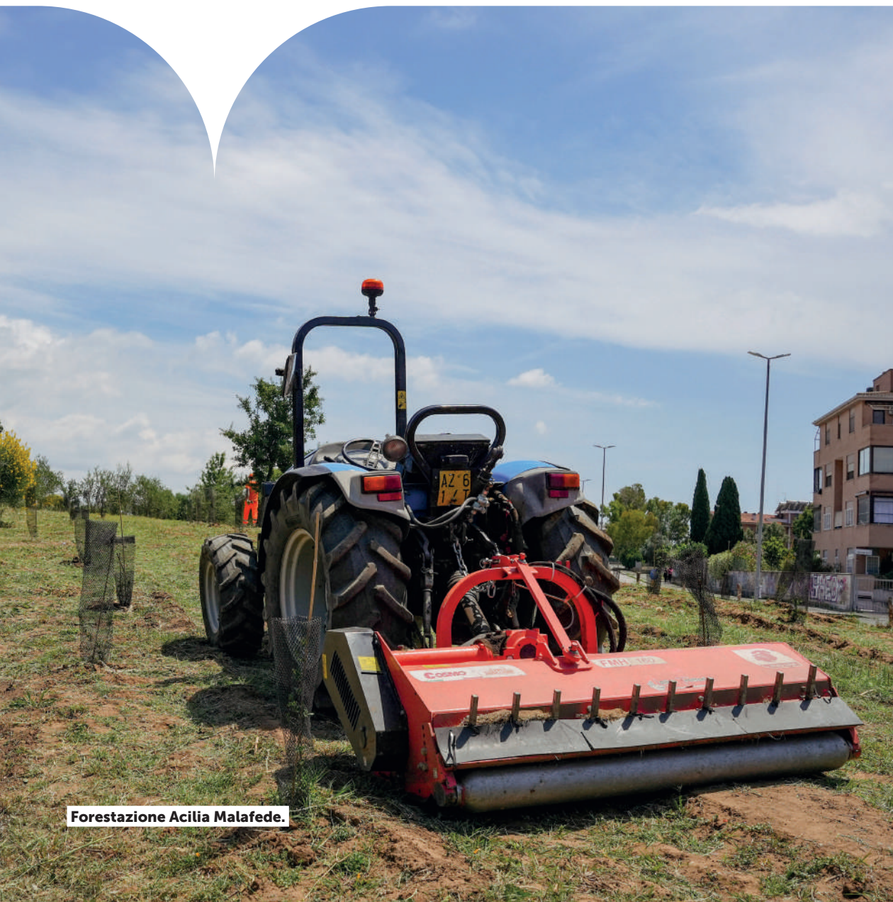
Forestazione Acilia Malafede.