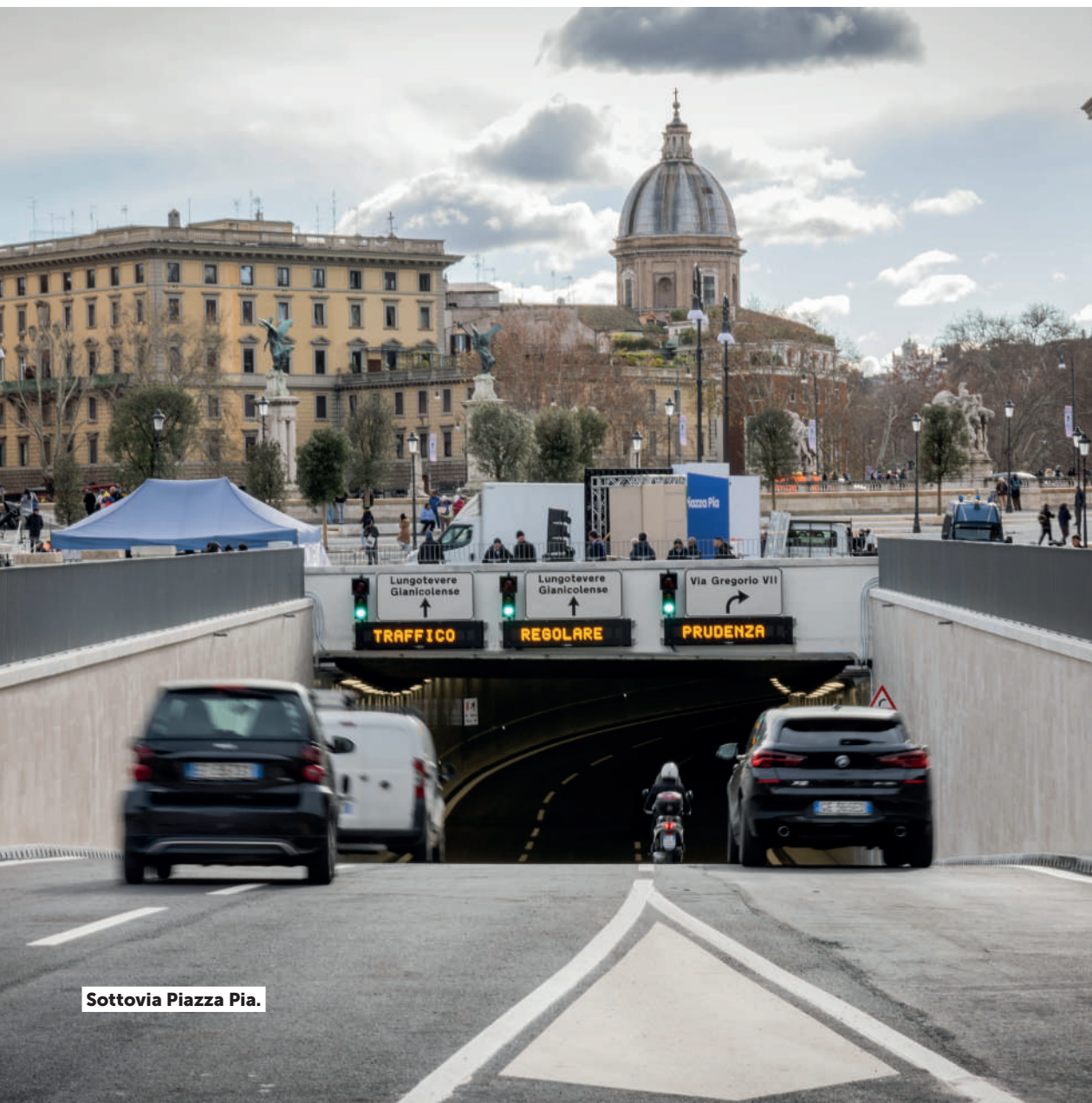
Sottovia Piazza Pia.