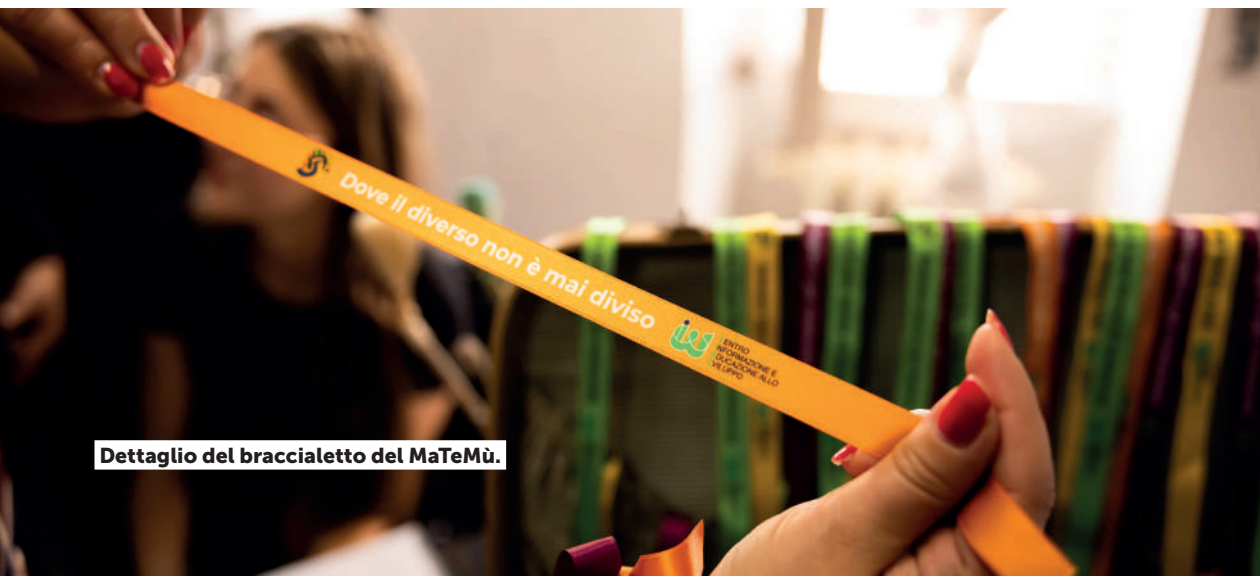
Dettaglio del braccialetto del MaTeMù.

A maggio 2025 Roma Capitale ha ospitato l'Assemblea nazionale della Rete Ready (Rete italiana delle Regioni, Province Autonome ed Enti Locali impegnati per prevenire, contrastare e superare le discriminazioni per orientamento sessuale e identità di genere) e nel 2024 aveva anche ospitato la IGR Bingham Cup 2024 – il Mondiale di Rugby per squadra LGBTQIA+, mettendo a disposizione gli impianti comunali.