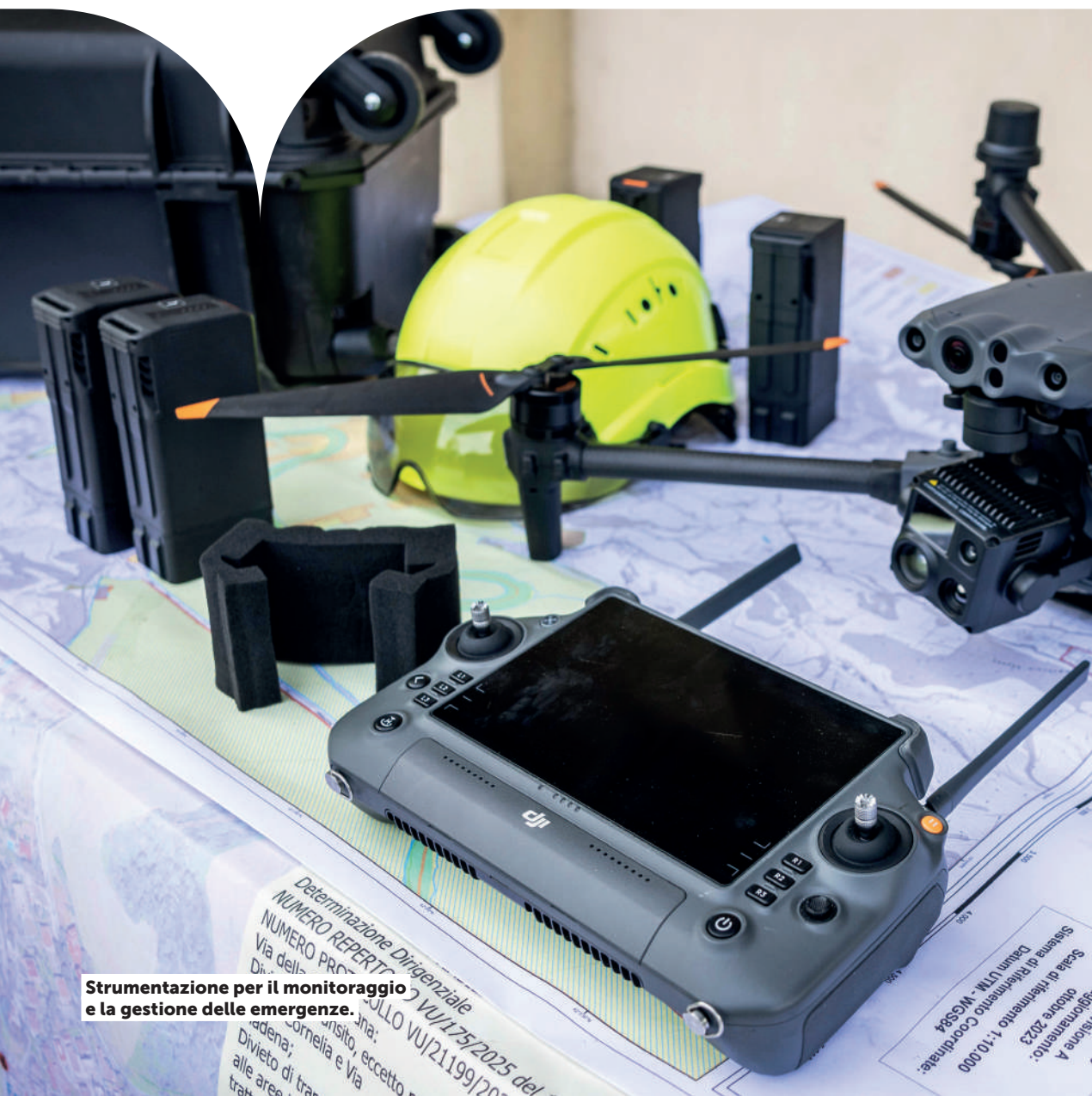
Strumentazione per il monitoraggio e la gestione delle emergenze.

Roma è una città grandissima, con un territorio connotato da significativi rischi rilevanti di Protezione Civile. La rete idrografica della città, così come gli estesissimi spazi verdi, possono trasformarsi rapidamente, a causa di eventi naturali o per effetto del comportamento degli uomini. La Protezione Civile capitolina non è solo gestione di grandi eventi o Giubileo, ma è anche impegno quotidiano.