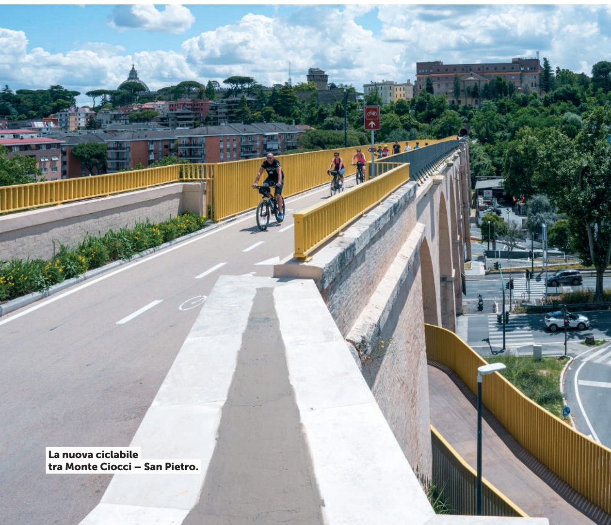
La nuova ciclabile tra Monte Ciochi – San Pietro.

Da settembre 2023 è partita l'installazione di bike box (posteggi chiusi per biciclette) per favorire in sicurezza (anche contro i furti) lo scambio bici/ferro. Attualmente i posti sono 663 in 18 stazioni della metropolitana, di cui una parte realizzati con Fondi PON Metro e l'altra parte con fondi MIMS. L'accesso è gratuito per chi ha l'abbonamento Atac. È in corso la progettazione di un'ulteriore fase di realizzazione, per la quale è stata inviata un'istanza di finanziamento al Ministero, per ulteriori 280 posti.