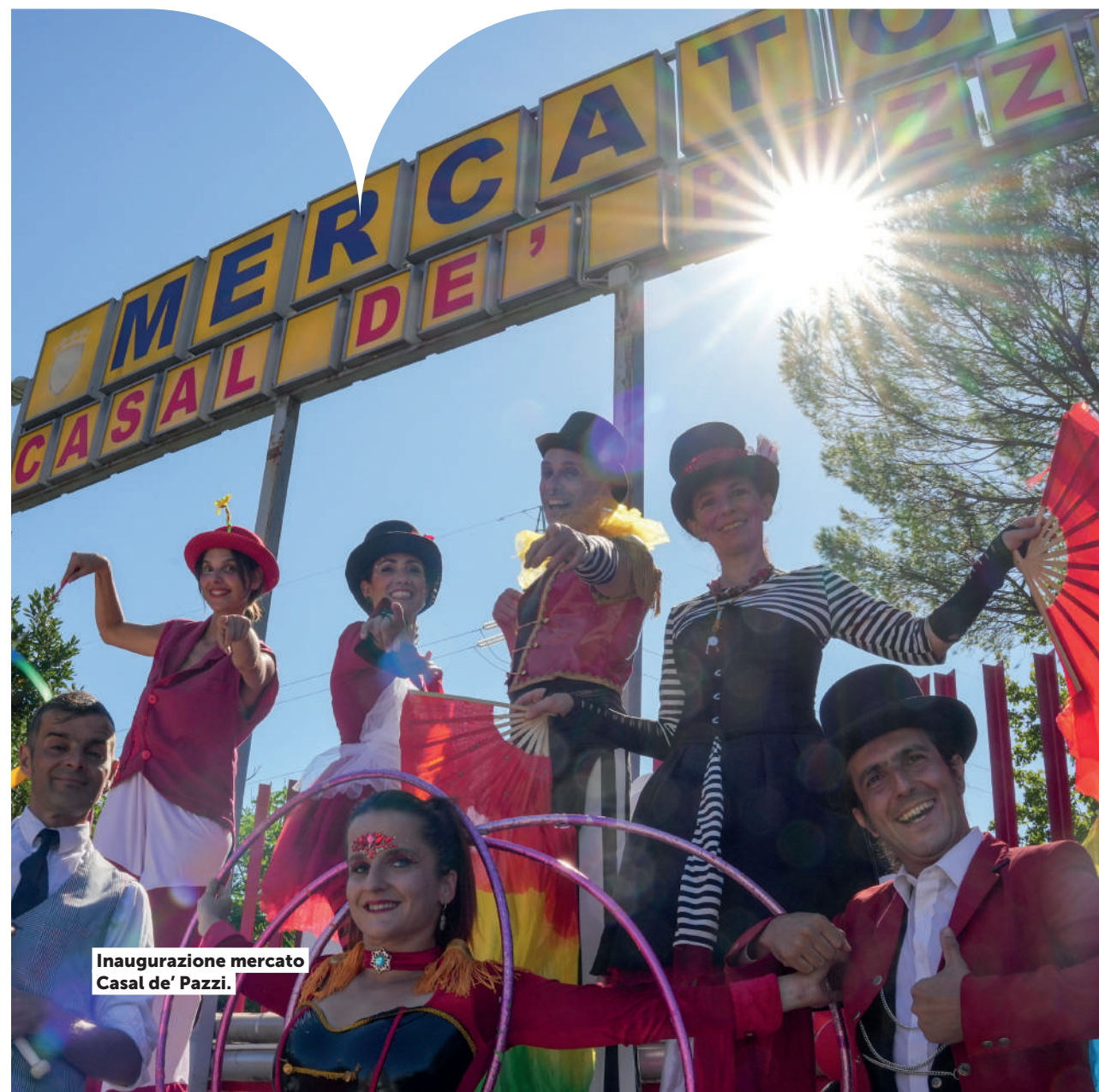
Inaugurazione mercato Casal de' Pazzi.