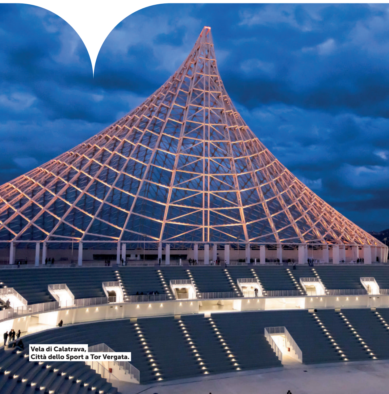
Vela di Calatrava, Città dello Sport a Tor Vergata.