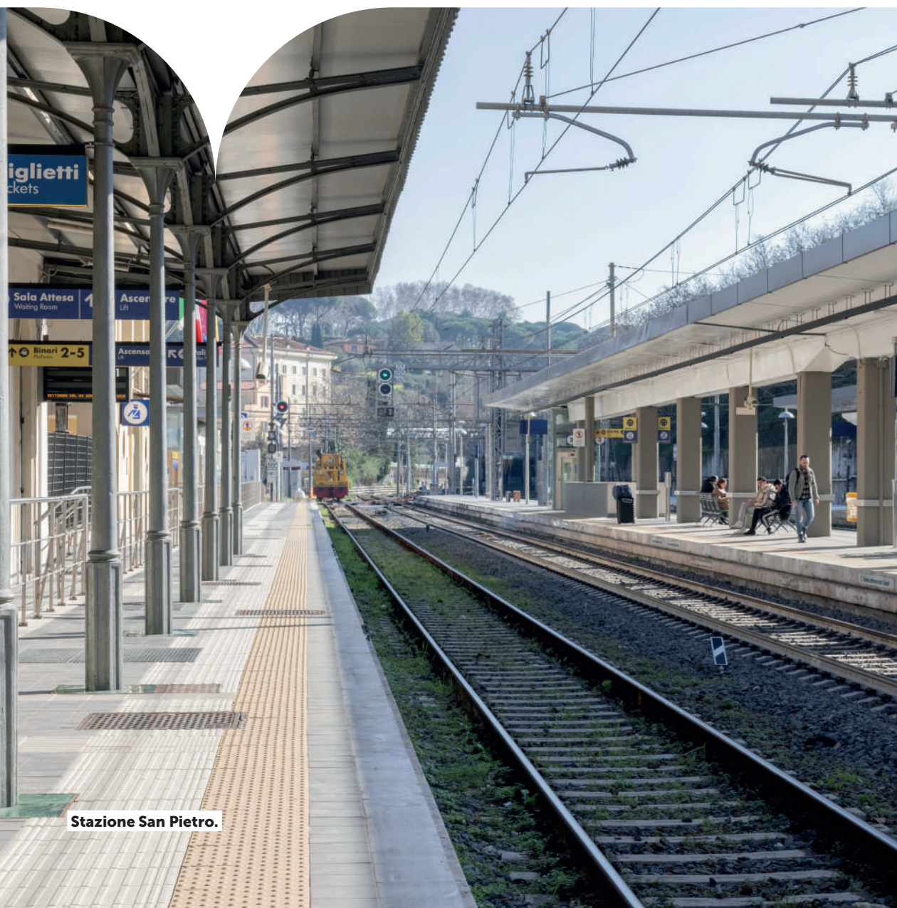
Stazione San Pietro.

Dopo la riapertura nel 2022 della stazione di Vigna Clara (attesa da 32 anni) con 9 coppie di treni (18 corse) giornaliere, partiranno entro la fine del 2025 i cantieri Rfi per il raddoppio della tratta tra Valle Aurelia e Vigna Clara , la penultima del cosiddetto anello ferroviario, prima di appaltare anche i restati 3,5 km tra Vigna Clara e Val d'Ala (zona Prati Fiscali).