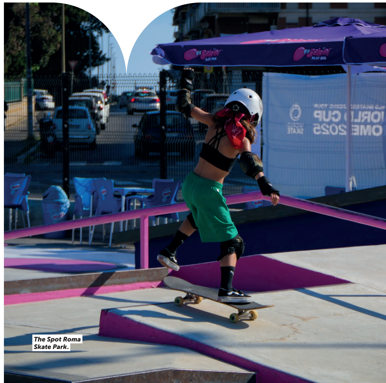
The Spot Roma Skate Park.