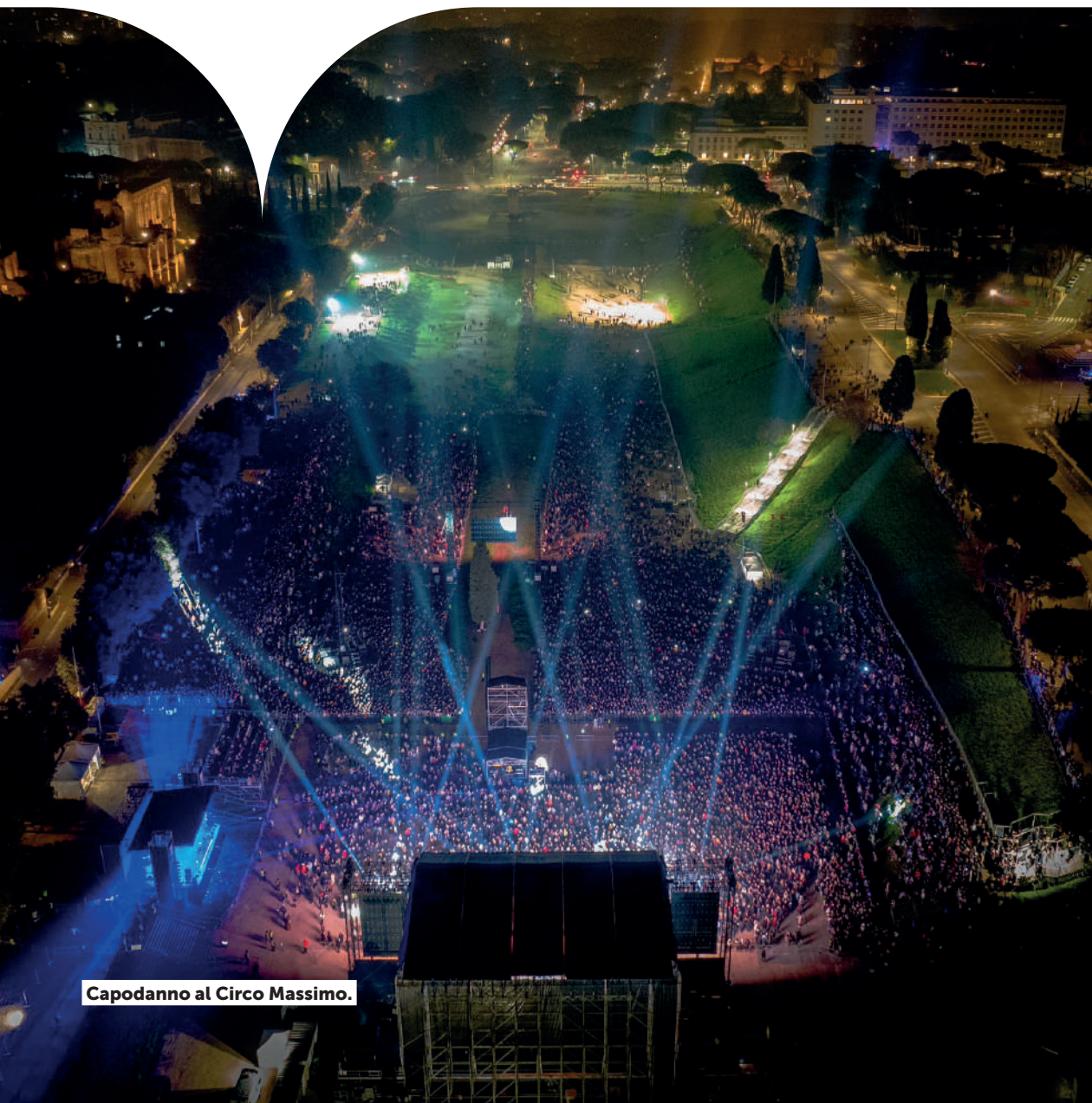
Capodanno al Circo Massimo.

Come confermato dal Rapporto ACOS, presentato a giugno 2025, le manifestazioni culturali nel 2023 e nel 2024 sono aumentate di quasi il 60% rispetto al 2019 (anno prima del Covid), da meno di 400 a più di 600 in media.