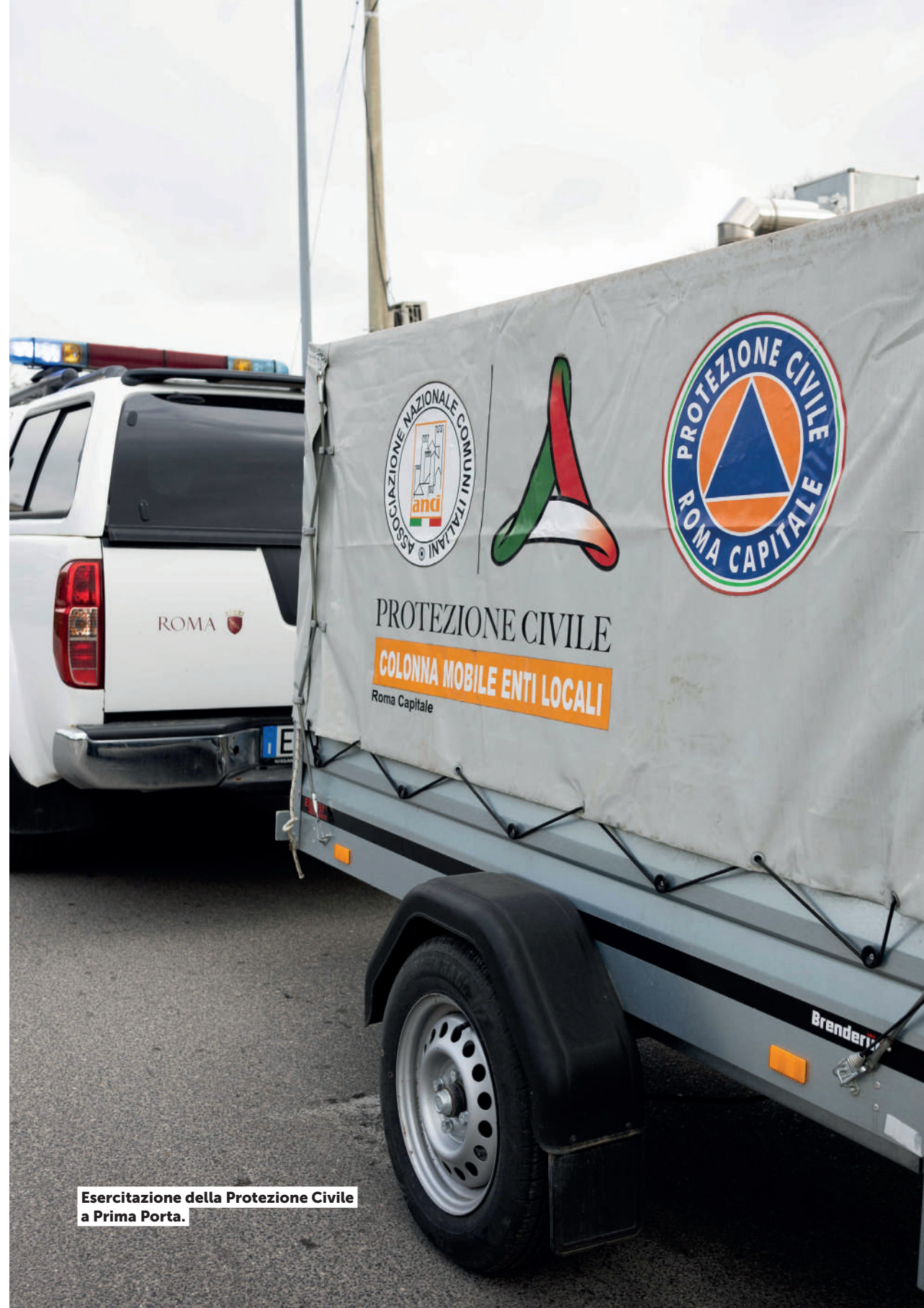
Esercitazione della Protezione Civile a Prima Porta.

Stanziati più fondi per la manutenzione straordinaria dei 3.000 idranti stradali , con 4,7 milioni di euro per il triennio 2023-25. Nel 2024 controllati quasi 2.000 idranti e riparati a centinaia. Nel 2025, oltre alla prosecuzione della manutenzione, sono stati montati 10 idranti di nuova generazione e 279 teste pensanti. Nel 2026 si prevede l'installazione di 400 teste pensanti, di cui 200 già pronte per essere montate e 200 in arrivo; 50 idranti di nuova generazione, di cui 15 già disponibili e 35 che saranno consegnati a breve.