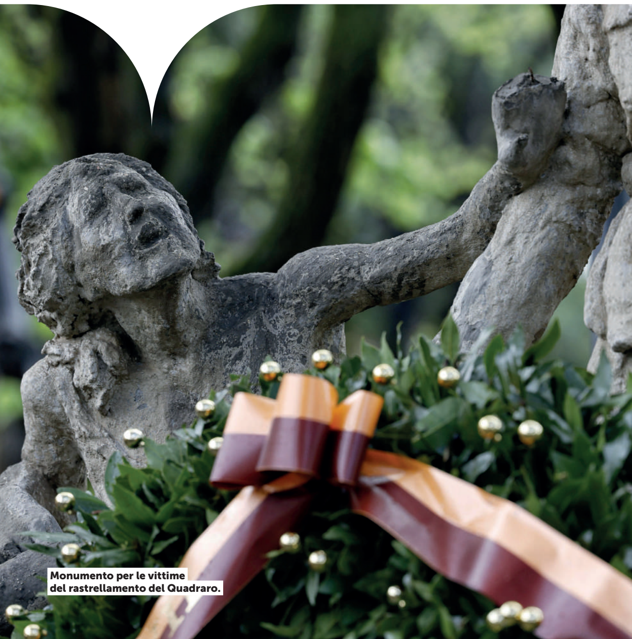
Monumento per le vittime del rastrellamento del Quadraro.