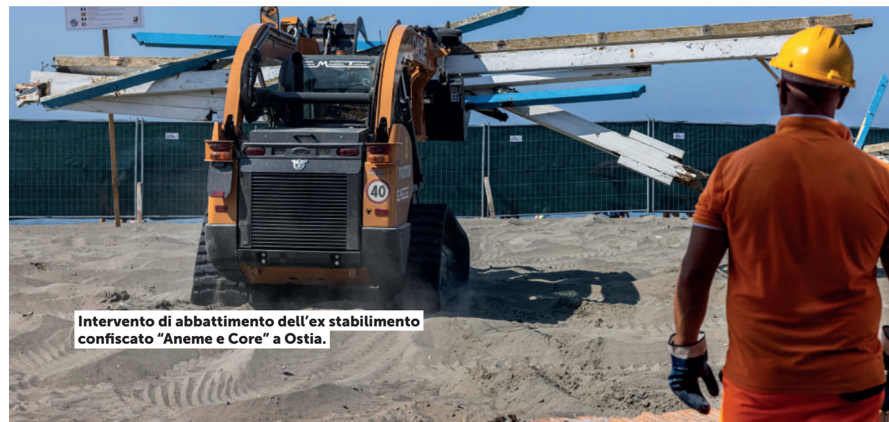
Intervento di abbattimento dell'ex stabilimento confiscato "Aneme e Core" a Ostia.

Felicità è il palcoscenico delle realtà del patrimonio che quotidianamente animano gli immobili di Roma Capitale con progetti sociali, culturali ed educativi: associazioni, cooperative, enti del terzo settore. Un mosaico di esperienze che racconta una città inclusiva, partecipata e capace di rigenerare i propri spazi attraverso la creatività e l'impegno civico. Non solo una festa collettiva, ma l'idea di una nuova Città pubblica.