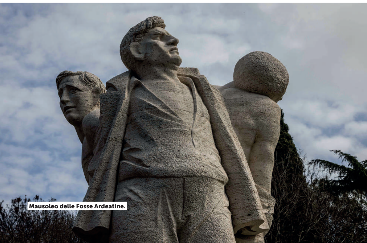
Mausoleo delle Fosse Ardeatine.

Si è avviato inoltre un lavoro sulla toponomastica coloniale, incentrato sull'analisi e sulla ri-significazione delle numerose didascalie presenti nelle targhe toponomastiche che fanno riferimento o usano linguaggi celebrativi di epoca coloniale e/o fascista. Con lo stesso obiettivo, il restauro del monumento ai caduti di Dogali in viale Luigi Einaudi è stata l'occasione per sostenere un progetto volto alla realizzazione di un podcast incentrato su quella pagina sanguinosa del colonialismo italiano.