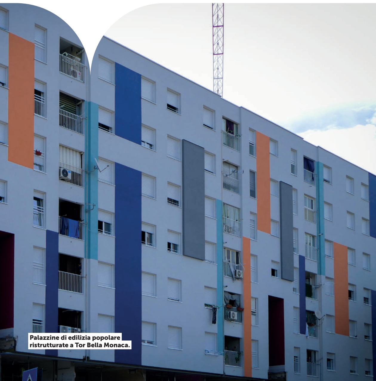
Palazzine di edilizia popolare ristrutturate a Tor Bella Monaca.

Roma Capitale ha fatto dell'abitare un pilastro centrale delle sue politiche sociali con il Piano Casa 2023-2026 , che disegna una cornice strategica per garantire il diritto alla casa, combattere le disuguaglianze abitative e intervenire in modo strutturale contro l'emergenza.