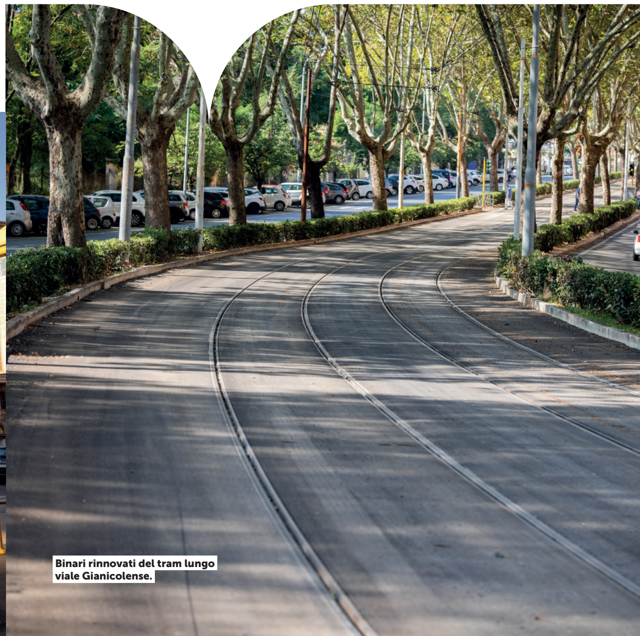
Binari rinnovati del tram lungo viale Gianicolense.