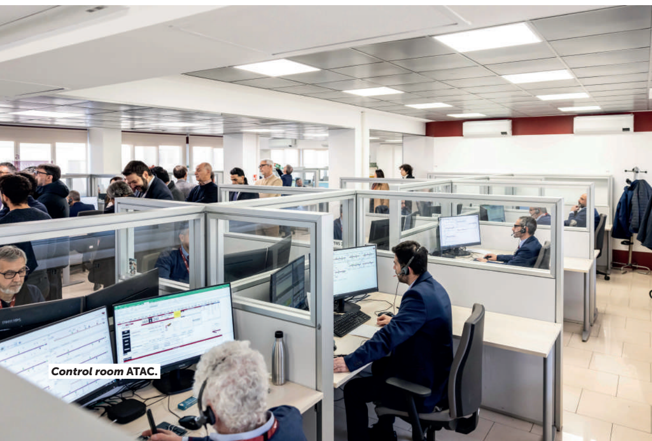
Control room ATAC.

Dopo il ritorno nel 2023 a Roma Capitale del 75% delle quote della Centrale del Latte di Roma S.p.A. (come da sentenze), che si aggiungono al quasi 7% già detenuto e in attesa del giudizio definitivo della Cassazione, l'Amministrazione comunale sta garantendo la continuità aziendale prima di poterla rimettere sul mercato.