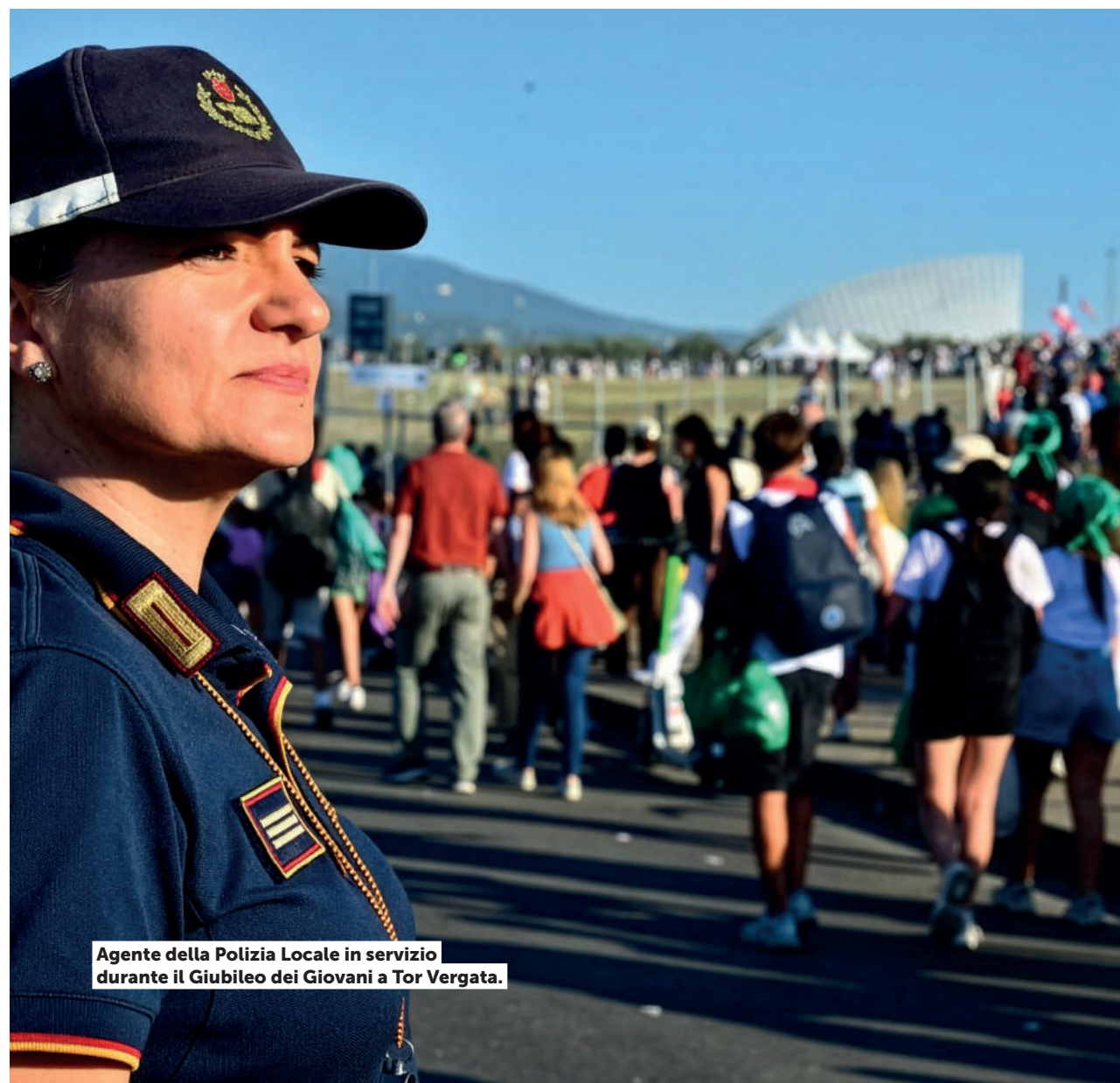
Agente della Polizia Locale in servizio durante il Giubileo dei Giovani a Tor Vergata.

Particolare attenzione, inoltre, alla tutela dei soggetti particolarmente vulnerabili maggiormente esposti a particolari fenomeni di illegalità, quali le truffe agli anziani, la violenza di genere, la delinquenza minorile (con particolare riferimento ai fenomeni del bullismo e del cyberbullismo giovanile ( "baby gang" )).