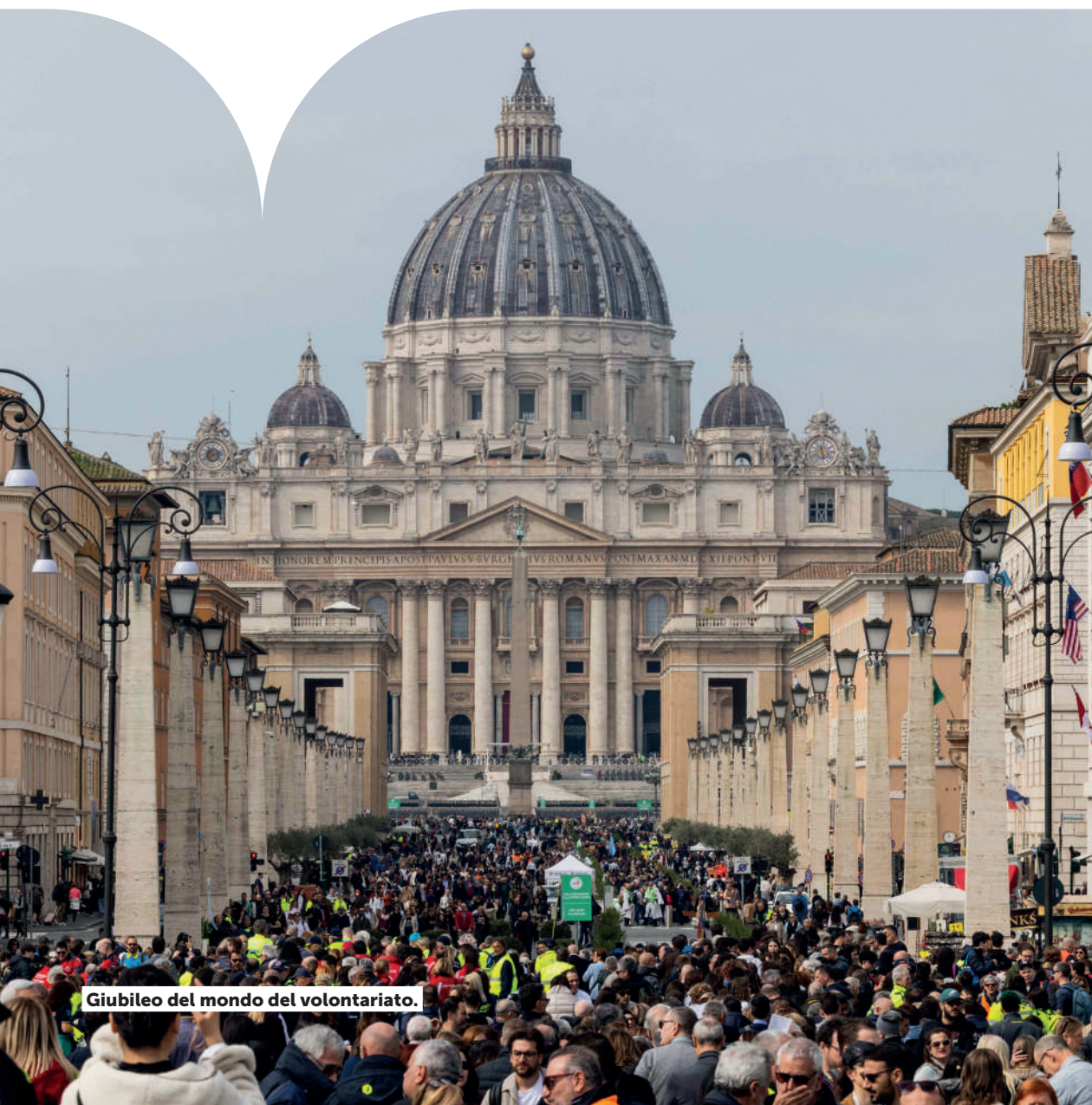
Giubileo del mondo del volontariato.

I vari fondi destinati alla Roma del futuro (Giubileo, PNRR, altri europei, partenariato pubblico-privati, statali e comunali) sono cresciuti a oltre 17 miliardi di euro , integrati nel piano Next Generation Rome e prodotto circa 1.200 cantieri: 6,6 miliardi provengono da fondi nazionali, una quota importante – 4,3 miliardi – è legata agli interventi per il Giubileo, affiancata da 1,2 miliardi di fondi PNRR gestiti direttamente da Roma Capitale. A questi si sommano ulteriori risorse da programmi europei e nazionali (come il PN Metro e il DL Aiuti), per circa 500 milioni. E sono cresciute le componenti legate alle partnership con gli investitori privati (quasi 5 miliardi di euro).