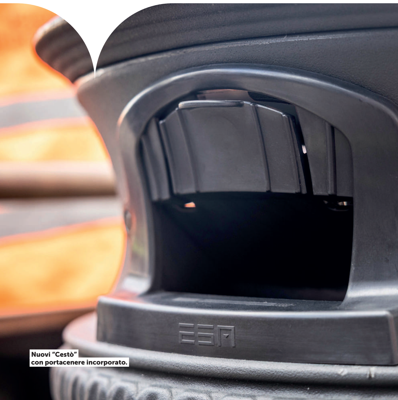
Nuovi "Cestò" con portacenere incorporato.

Roma produce ogni anno 1,6 milioni di tonnellate di rifiuti, più della metà del totale prodotto nella Regione Lazio, quasi il 6% dell'intero volume nazionale. E lo fa su un territorio di circa 1.300 kmq, con 2,8 milioni di residenti, ai quali si aggiungono 500.000 pendolari che arrivano da fuori città e i turisti.