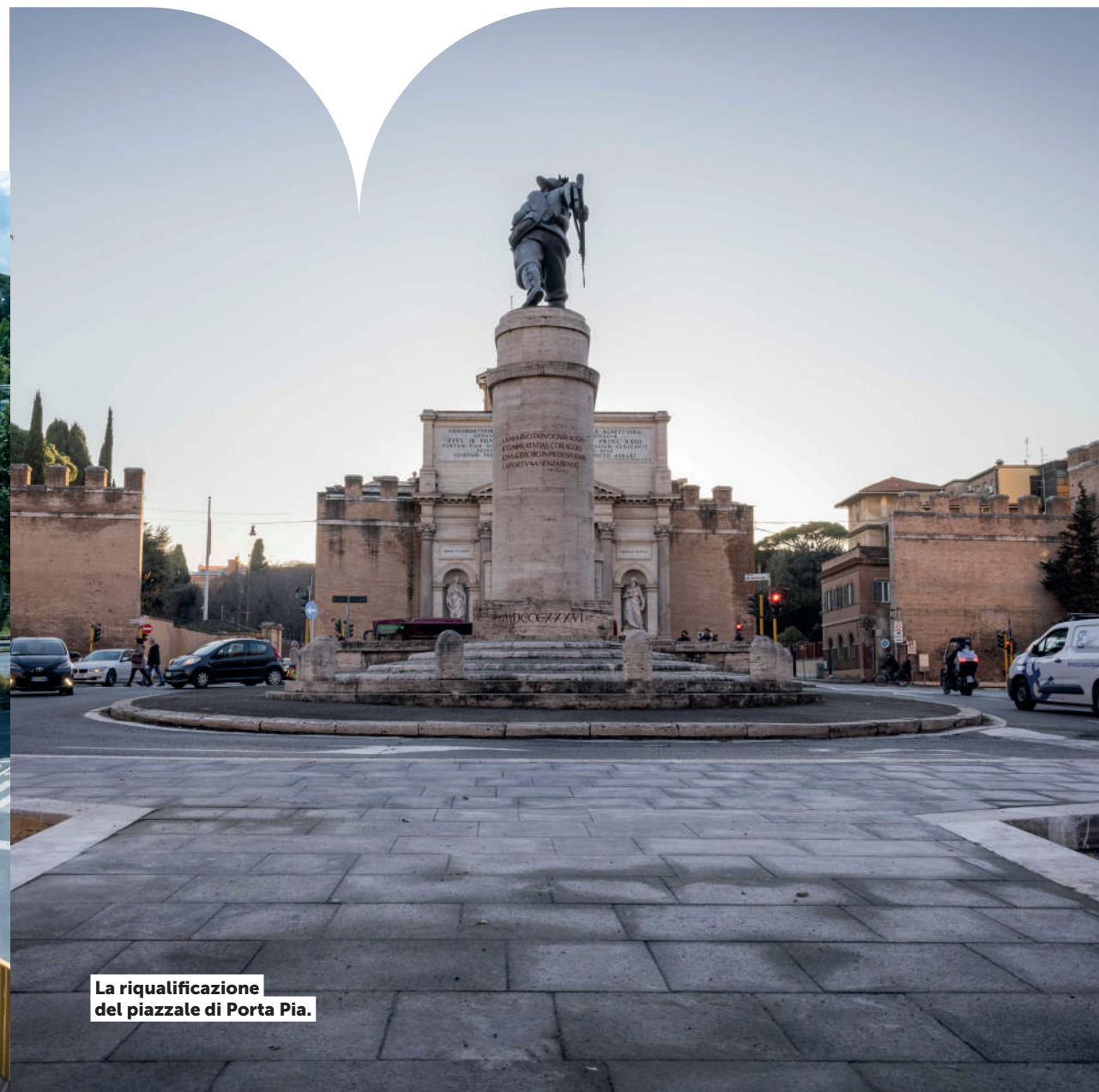
La riqualificazione del piazzale di Porta Pia.