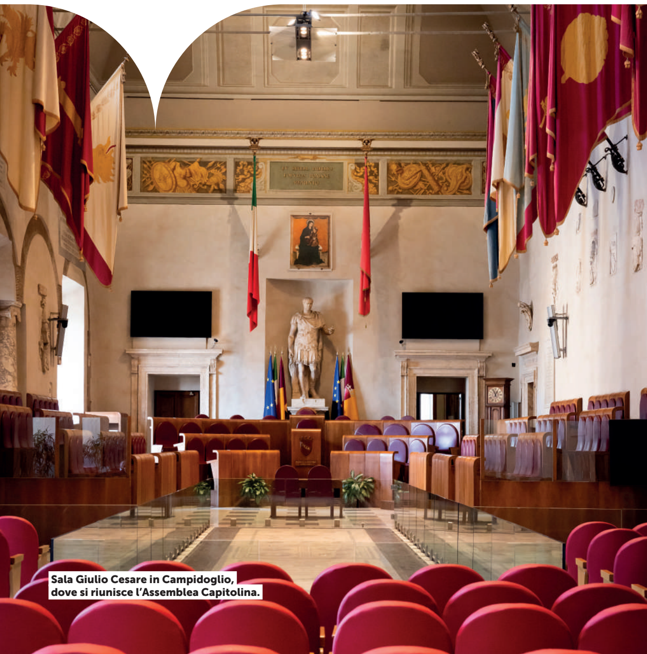
Sala Giulio Cesare in Campidoglio, dove si riunisce l'Assemblea Capitolina.

Dopo che già ad agosto 2024 Standard & Poor's aveva certificato la solidità crescente dei conti capitolini, assegnando a Roma un giudizio migliorativo che mancava da anni, passando da BBB- a BBB con outlook stabile, Roma Capitale ha proseguito nel percorso di rafforzamento del bilancio, con un'azione incisiva sul fronte della riorganizzazione e del recupero delle entrate.