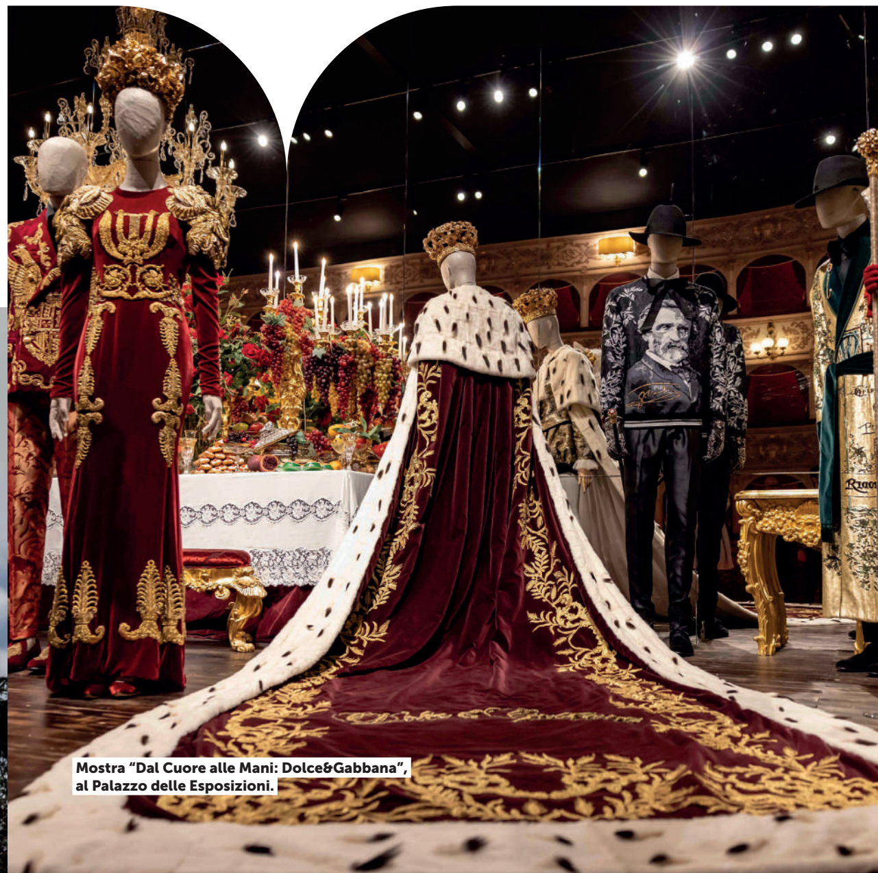
Mostra "Dal Cuore alle Mani: Dolce&Gabbana", al Palazzo delle Esposizioni.